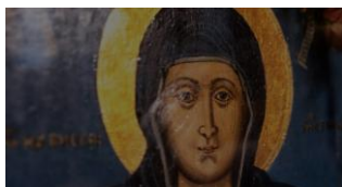
Sfânta Mucenita Anastasia de la Biserica Sfântul Nicolae Udricani din capitala